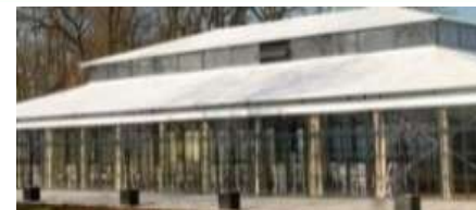
Château de Nolet